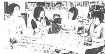
神埼町保健センターのスタッフ。市町村保健センターには、自分たちで企画立案している充実感があるという。城野さんについては「このままの人です(笑)」[ニコニコしていつもうれしくて、しかも頼りがいのある上司。ただ健康教育の寸劇などで、お客(住民)が笑うまえに自分が笑ってしまうのが難点(笑)]と同僚の保健婦

かしその後、住民から、何故このような検査をするのかという不安の声が発生しました。これではいけないと町内の医師らが集まって肝炎対策委員会を設