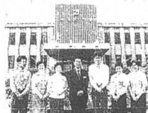
健康増進課長勇推進係のみなさん。介護保険、介護予防などで連携をとる

かしその後、住民から、何故このような検査をするのかという不安の声が発生しました。これではいけないと町内の医師らが集まって肝炎対策委員会を設