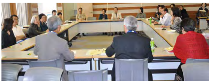
写真左：患者交流会 写真左下：交流会で発言する参加者 写真右下：会役員による会報発送作業