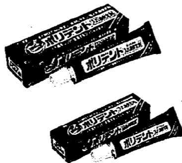
ポリデント入れ歯安定剤 (手前:40g、奥:65g)