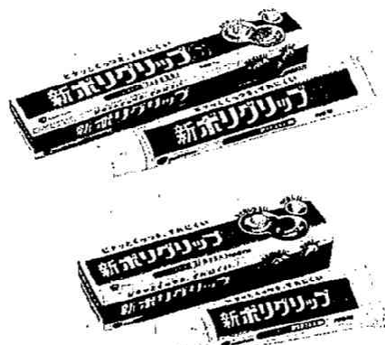
新ポリグリップS (手前:40g、奥:75g)