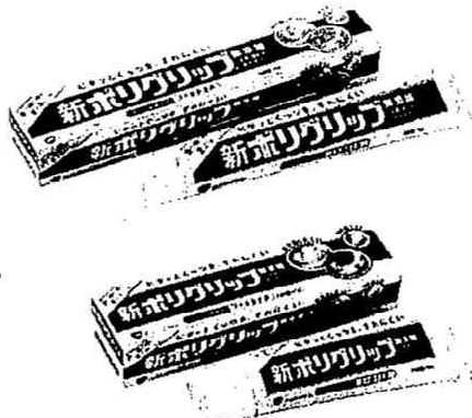
新ポリグリップ無添加 (手前:40g、奥:75g)