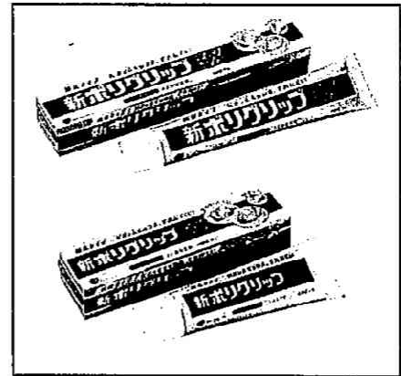
新ポリグリップ EX (手前 40g、奥 75g)

グラクソ・スミスクライン株式会社(本社:東京都渋谷区、社長:フィリップ・フォシェ)は、亜鉛を含有する入れ歯安定剤「新ポリグリップ EX」の販売を中止し店頭からの自主回収をすることを決定しましたのでお知らせいたします。