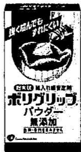
ポリグリップ パウダー無添加 (50g)